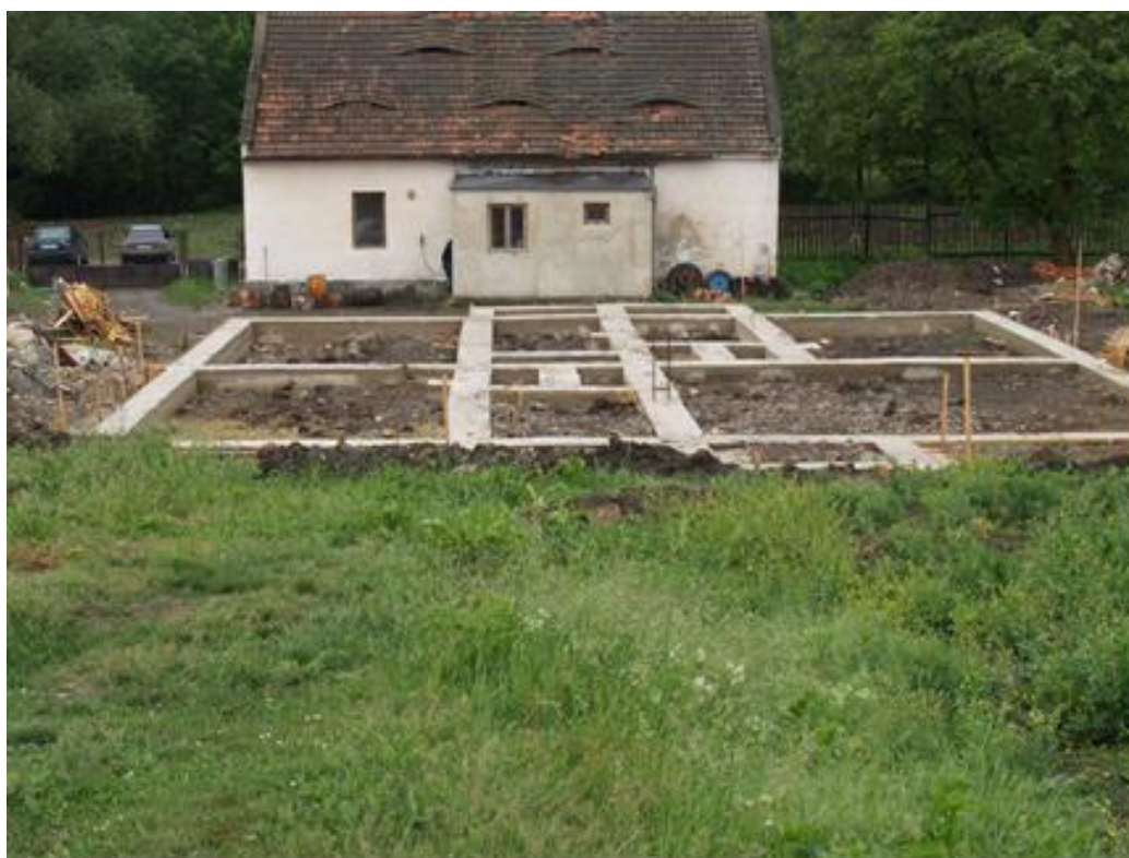
FOTOGRAFIE č. 1

Na fotografii číslo dvě vidíme položená potrubí na odpady, které jsou vyvedené nad úroveň budoucí roviny celkového přízemního podlaží. Otvory potrubí se zazátkují nebo ucpou například novinami, aby se do potrubí nedostaly nečistoty.