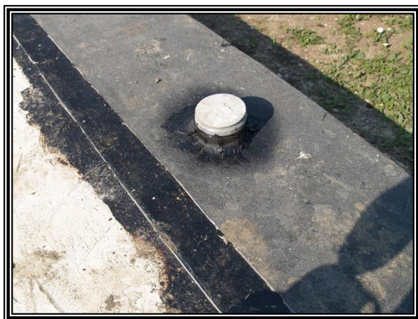
Důkladné olepení prostupu