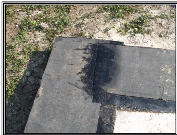
Přelepění s přesahem